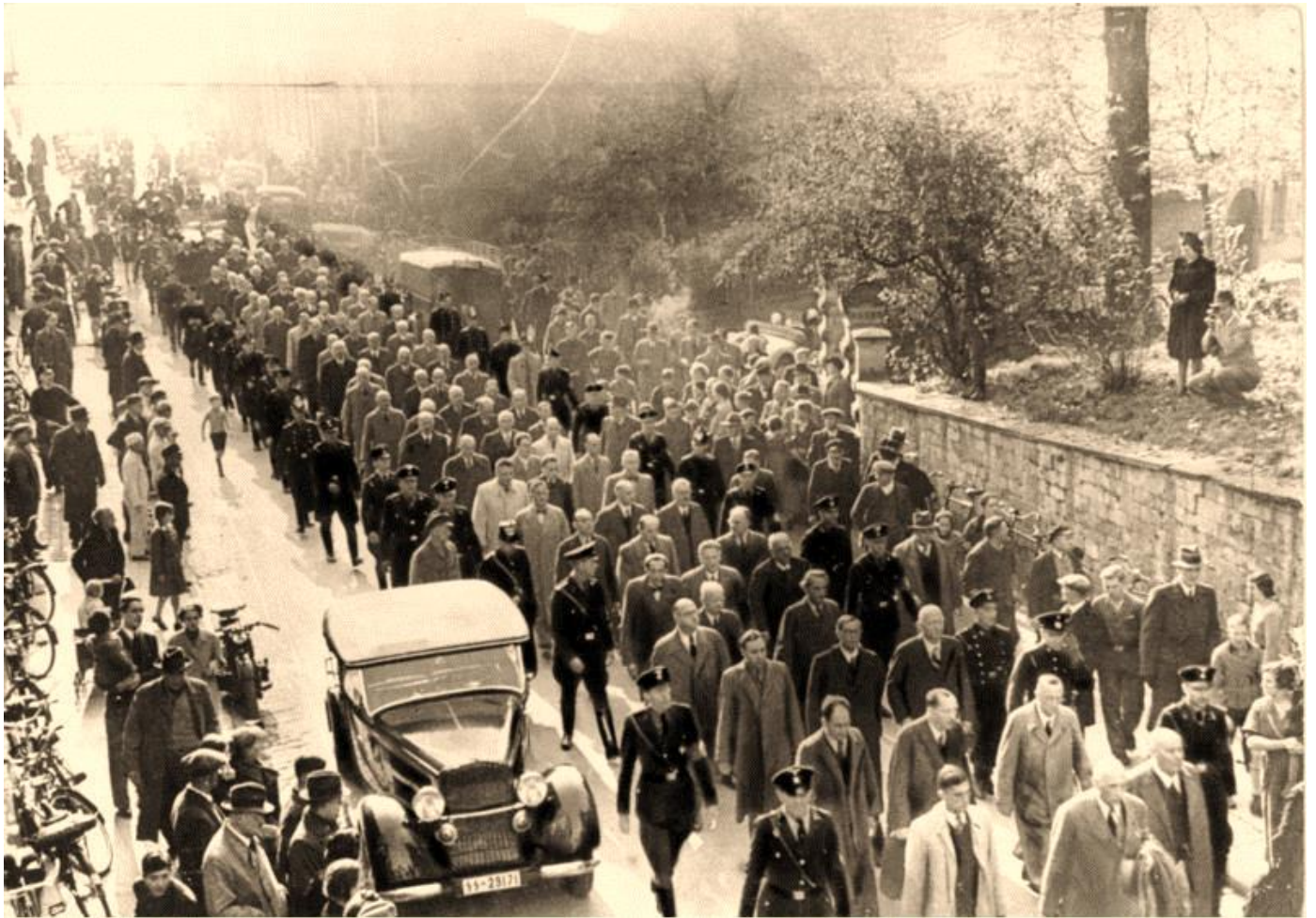
Mitte November 1938 wurden etwa 30.000 Männer wegen ihrer jüdischen Herkunft in „Schutzhaft“ genommen und in Konzentrationslager verschleppt.